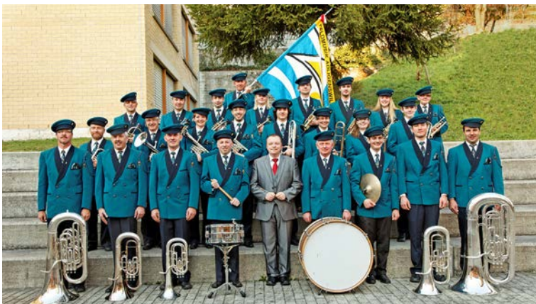
Aktive Musikantinnen und Musikanten 2012